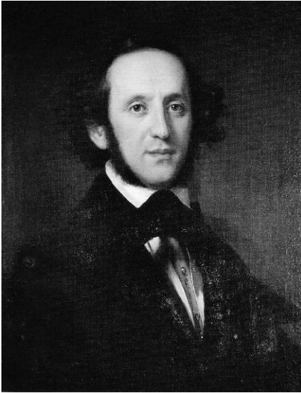
Felix Mendelssohn Bartholdy Gemälde von Eduard Magnus (1846)

Renaissance. Diese romantische Shakespeare-Renaissance wurde vor allem durch die von August Wilhelm Schlegel und Ludwig Tieck begonnenen deutschen Übersetzungen eingeleitet. Im Hause Mendelssohn wurden verschiedene Dramen William Shakespeares mit verteilten Rollen vorgelesen oder im größeren Freundeskreis aufgeführt. Der siebzehnjährige Felix Mendelssohn begeisterte sich vor allem für die Komödie „Ein Sommernachtstraum“, die ihn zu einer Konzertouvertüre inspirierte. Das Werk wurde zunächst