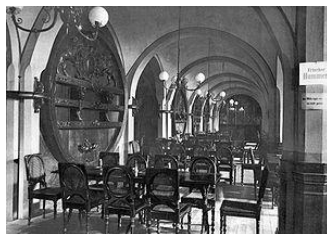
Bremer Ratskeller um 1900

Das Programm des 3. Profile-Konzerts verbindet Wilhelm Hauffs Erzählung „Phantasien im Bremer Ratskeller“ mit Felix Mendelssohn Bartholdys Musik zu William Shakespeares Schauspiel „Ein Sommernachtstraum“. Diese Verbindung erscheint verlockend, handelt es sich doch um zwei exemplarische Werke der