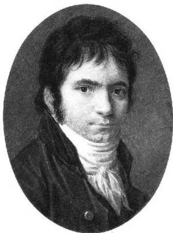
Ludwig van Beethoven, Miniaturbild von Christian Hornemann, 1803

Den zweiunddreißig Klaviersonaten von Ludwig van Beethoven wird gewöhnlich mit einer fast schon ehrfürchtigen Hochachtung begegnet. Das ist begründet, weil die Sonaten einen respektablen Überblick über das Schaffen des Komponisten geben. Die verschiedenen Schaffensperioden kommen hier vor. Von jugendlichem Überschwang geprägte Stücke sind hier ebenso vertreten wie gedankentiefe Spätwerke. Nicht