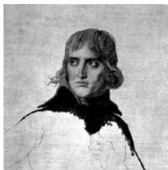
Napoleon I., Ölstudie von Jacques Louis David, 1799

Angeblich soll Ludwig van Beethoven die Idee, eine Sinfonie zur Verehrung des französischen Generals Napoleon Bonaparte zu schreiben, bereits im Frühjahr 1798 von dem französischen Gesandten Graf Bernadotte erhalten haben. Zu dieser Zeit lag noch keine der Beethoven-Sinfonien vor. Die Arbeit wurde zurückgestellt, und in den Jahren 1800 und 1803 wurden zunächst die erste Sinfonie