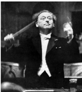
Willem Mengelberg, Widmungsträger der Strauss-Tondichtung "Ein Heldenleben"

„Ein Heldenleben“ scheint das Selbstporträt eines Musikers und auch das Porträt seiner Zeit zu sein. Wer war Richard Strauss?“