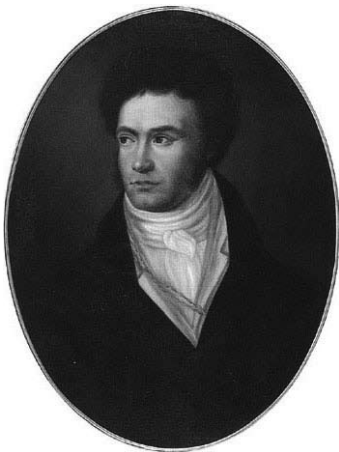
Ludwig van Beethoven, Ölgemälde von Isidor Neugass, 1806