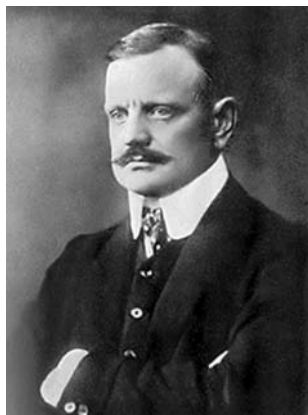
Der Komponist Jean Sibelius, 1913

Im ausgehenden 19. und im beginnenden 20. Jahrhundert hatten die Orchesterkomponisten sich zu entscheiden. Demzufolge wandten sie sich entweder der Sinfonie oder der Sinfonischen Dichtung zu: Anton Bruckner und Gustav Mahler begründeten ihren Ruhm auf dem Gebiet der Sinfonie, während Richard Strauss und Claude Debussy sich eher der Sinfonischen Dichtung widmeten. Es soll an dieser Stelle nicht darüber reflektiert werden, ob die Sinfonische Dichtung wirklich