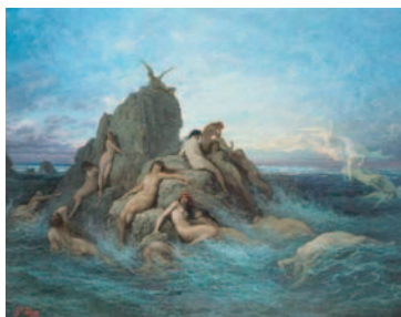
Gustave Doré: „Die Okeaniden“, 1860

Jean Sibelius reiste dann im Mai 1914 nach Norfolk und dirigierte am 4. Juni ein Porträtkonzert. Bei dieser Gelegenheit erklang die Tondichtung „ Die Okeaniden “ zum ersten Male, außerdem standen die erste Sinfonie, die Suite „ König Kristian II. “ sowie die Tondichtungen „ Pohjolas Tochter “ und „ Finlandia “ auf dem Programm. Schon bei der ersten Probe war Sibelius beeindruckt von dem einhundert Mitglieder zählenden Orchester: „ Das beste Orchester, das ich je dirigiert habe “, findet sich als eine Äußerung des Komponisten in seiner Korrespondenz nach Finnland. Bei dem Porträtkonzert selbst waren nur geladene Gäste anwesend, und sie besicherten dem Komponisten einen Erfolg, wie er ihn in diesem Ausmaße bisher noch nicht erlebt hatte. Sibelius erhielt die Ehrendoktorwürde der Yale University, und er trat die Heimreise nach Finnland im Bewusstsein an, schon im nächsten Jahr wieder in die Vereinigten Staaten zurückzukehren. Der Ausbruch des Ersten Weltkriegs machte diese Pläne wieder zunichte.