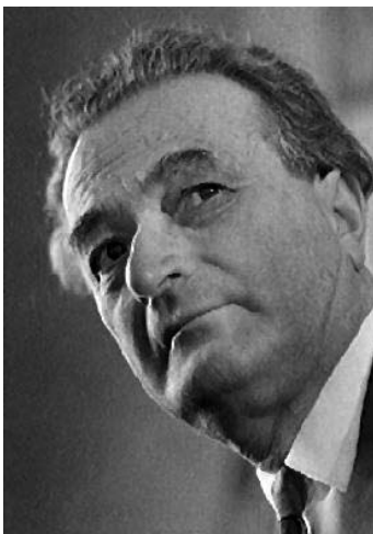
Ahmed Adnan Saygun

1931 beendete der türkische Komponist Ahmed Adnan Saygun seine Studienaufenthalt in Paris und kehrte in seine Heimat zurück. Dort wandte er sich zunächst der Oper und der Kammermusik zu. Er war kein Vielschreiber, zumal die Aufgaben beim Aufbau des türkischen Musiklebens viel Zeit in Anspruch nahmen. Schließlich lag auch das bedeutende Oratorium „Yunus Emre“ (1946) vor, bevor die großen Orchesterkompositionen