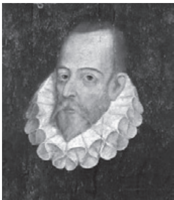
Miguel de Cervantes Saavedra

über die ersten Pariser Aufführungen: „Das Publikum erstickt vor Entrüstung... Dieses alte ehrliche französische Publikum, das um so größeren Wert auf die hochheiligen Regeln der klassischen Korrektheit und des guten musikalischen Geschmacks legt, je weniger musikalisch es ist. Es duldet keinen Scherz. Die Leute sind außer sich über das Blöken von Schafen; sie glauben, man wolle sich über sie lustig machen, man bringe ihnen nicht die gehörige Achtung entgegen. Schreie: ‚Das ist gemein!...‘ Dem spöttischen und verschlafenen Strauss scheint alles gleichgültig zu sein...“ Und überhaupt klingt in die Diskussionen noch hinein, was der Wiener Kritiker Eduard Hanslick (1825-1904) über Programmmusik gesagt hatte: „Erzählt uns das Programm nicht ganz detailliert, was ein jeder Symphoniesatz vorstellt, so wird die Komposition unverständlich; geschieht es aber, so wird sie lächerlich.“