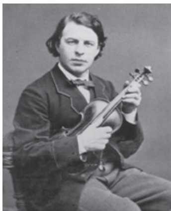
Der Geiger Joseph Joachim

Dass die Violine häufige Umspielungen zu spielen hat, zeigt sich nicht zuletzt im Larghetto, für das Beethovens Schüler Carl Czerny eine knappe und zutreffende Vortragsanweisung formulierte: „Mit grösster Empfindung und Zartheit vorzutragen.“ In diesem Satz, dem sich wie bei den beiden letzten Klavierkonzerten unmittelbar das Finale anschließt, geht der Komponist über die zuvor entstandenen und noch immer beliebten Violinromenzen G-Dur op. 40 und F-Dur op. 50 hinaus. Ist das Rondo zwar der konventionellste Satz des Konzerts, kommt hier die Virtuosität des Solisten besonders eindrucksvoll zur Geltung.