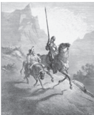
Don Quixote und sein Diener Sancho Pansa, Zeichnung von Gustav Doré, 1863

In der zweiten Variation ist das Heer des Kaisers Alifanfaron nichts weiter als eine Schaf- und eine Hammelherde, unter denen Don Quixote ein Blutbad anrichtet. Wenn Strauss mit Trillern und Tremoli der Streicher sowie den gedämpften Blechblasinstrumenten das Blöken der Herde ausdrückt und daneben auch die Rufe der Hirten nicht ausspart, so ist hier ein lautmalerischer Höhepunkt der Komposition erreicht. Die dritte Variation behandelt dann Gespräche von Herr und Diener, wie sie im Roman häufig vorkommen. In der vierten