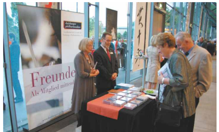
Auch bei der Ruhrtriennale präsent: Der Freundeskreis der Duisburger Philharmoniker