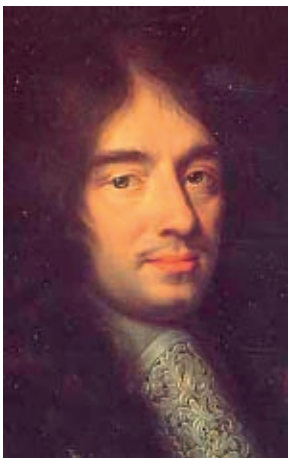
Der französische Schriftsteller Charles Perrault

Ausnahmslos im untersten Lautstärkebereich beginnen die fünf Stücke der Suite „ Ma mère l'oye “. Während einige Stücke in diesem Bereich verharren und sich durch Klarheit der Linienführung auszeichnen, gibt es in anderen Sätzen größere Aufschwünge. Überaus zart und schlicht ist das Eröffnungstück „ Pavane de la Belle au bois dormant “ („ Pavane Dornröschens “). In „ Petit Poucet “ irrt der Däumling durch den Wald, und wenn er feststellt, dass die Vögel alle Brotkrümel aufgefressen haben (Vogelrufe in der Partitur!) ändern die parallelen Terzen ihre Richtung. „ Laideronnette, Impératrice des Pagodes “ entführt in das ferne China: