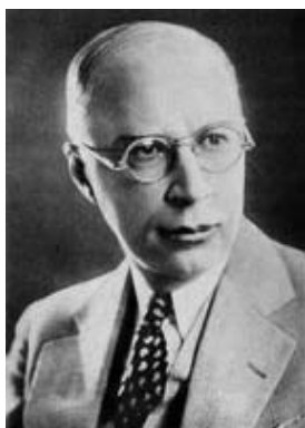
Der Komponist Sergej Prokofjew

Den Sommer des Jahres 1944 verbrachte Sergej Prokofjew im „ Haus des Schaffens “ des Komponistenverbandes in Iwamowo. Hier erfuhr der Komponist von den Kriegseignissen und den Erfolgen der russischen Armee. Diese Ereignisse fanden jedoch nur indirekten Eingang in die Komposition, sie werden allenfalls unterschwellig reflektiert. Vielmehr wollte Prokofjew den Wert des freien menschlichen Geistes betonen: „ In der Fünften Symphonie wollte ich einen freien