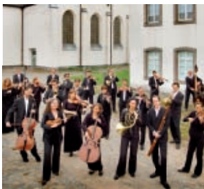
Das Neue Orchester

Samstag, 25. Februar 2012, 19.00 Uhr Salvatorkirche Duisburg