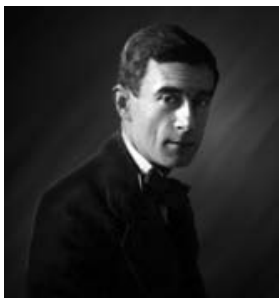
Der Komponist Maurice Ravel

Im Mai 1922 bezog Maurice Ravel ein Haus in Montfort-l'Amaury unweit der französischen Hauptstadt. Seine Freunde sahen den Komponisten in seiner Villa Belvédère umgeben von zahllosen Miniaturen, Imitationen von Chinoiserien, Nippesfiguren, Glaskugeln, Uhren und Tintenfassern im Stil von Kathedralen. Wer ihn hier besuchte, fühlte sich unweigerlich an Jonathan Swifts Romanfigur