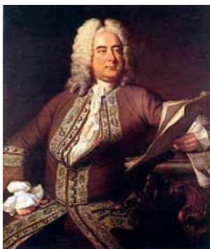
Georg Friedrich Händel, Ölgemälde von Thomas Hudson, 1749

Die Gestalt des alttestamentarischen Königs Salomo hatte den Menschen zu verschiedenen Zeiten Verschiedenes zu sagen. Ohne eine durchgehende Handlung beschreiben zu wollen, konzentrierte sich Ernest Bloch im Ersten Weltkrieg auf die warnenden Worte des Königs. Mehr als anderthalb Jahrhunderte früher schuf Georg Friedrich Händel eine große Komposition mit positiver Aussage. Auch solches ist möglich, denn Salomo war im zehnten vorchristlichen Jahrhundert der Herrscher des vereinigten Königreiches Israel, der den ersten Tempel in Jerusalem erbaute und für eine Zeit des Wohlstands und des Friedens garantierte.